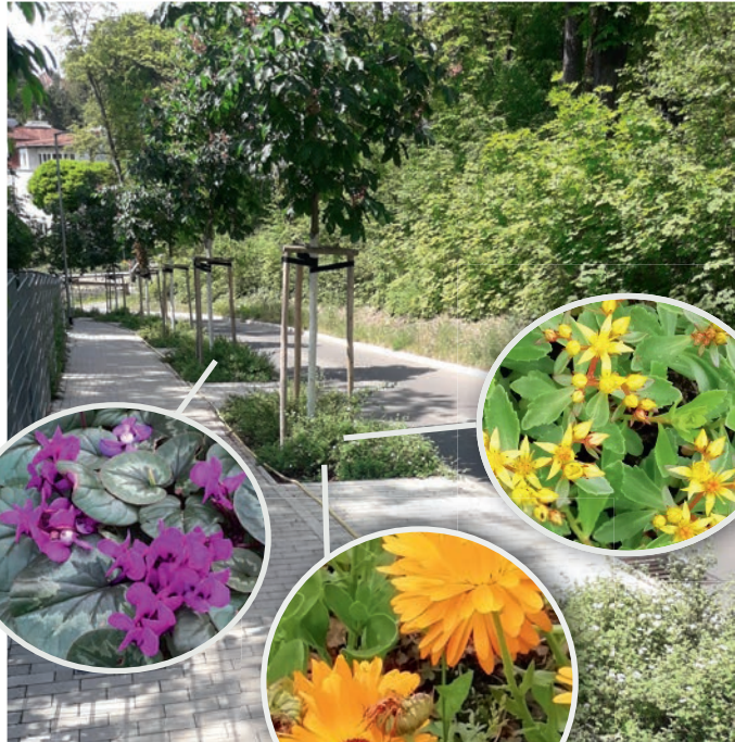
Beispiele für die Bepflanzung

In Jena Straßen stehen über 68.000 öffentliche Bäume, davon 4.800 Linden, 4.500 Kirschen, 3.970 Weiden, 1.850 Eichen, 1.550 Birken, 462 Birnen und viele andere Arten.